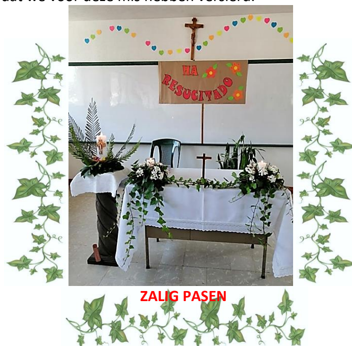
foto van het altaar dat we voor deze mis hebben versierd.

Wij wensen iedereen het geloof en het vertrouwen om vol te houden in de opdracht die de Heer aan elk van ons toevertrouwt.