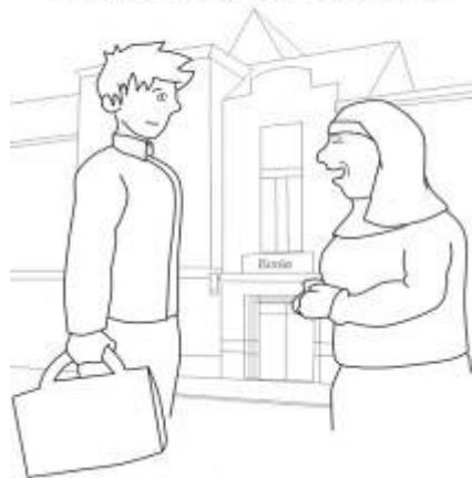
Les anciens élèves, l'école et les sœurs vous donnent de leurs nouvelles