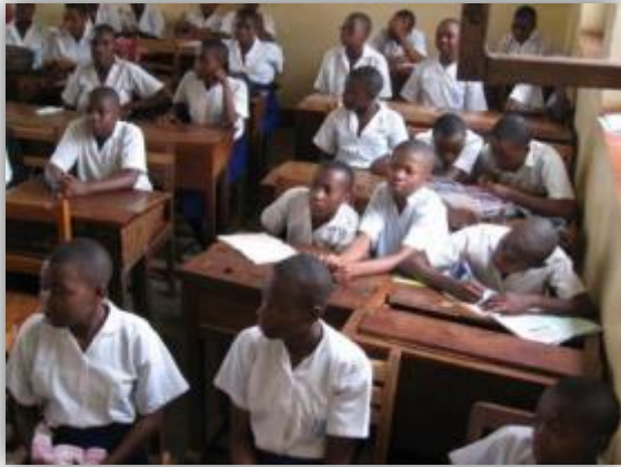
Lycée Wima = 7 Sœurs + 112 professeurs laïques + 2500 élèves