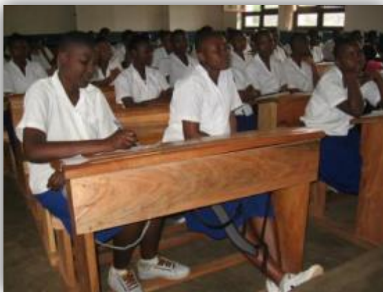
1 classe = 50 élèves et plus